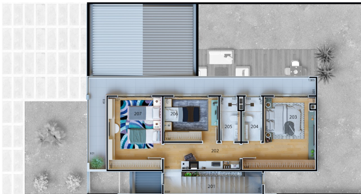
201 ESCADA 7,00 m 2