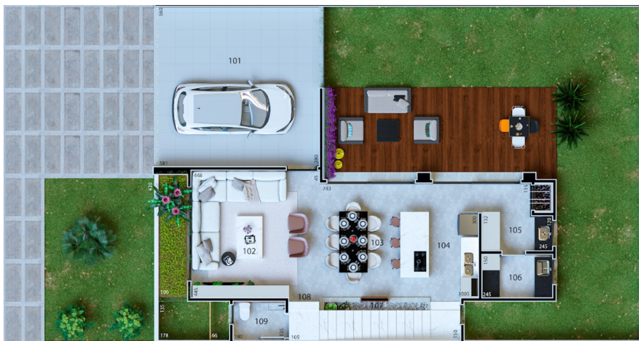
101 GARAGEM 32,35 m 2

O sistema construtivo conhecido mundialmente como “Light Steel Framing (LSF)”, também designado como sistema autoportante de construção em aço, tem como característica uma estrutura constituída por perfis leves de aço galvanizado formados a frio, unidos principalmente por fixadores e contraventados com a própria estrutura em aço, proporcionando, dessa forma, rigidez para a estrutura. Este conjunto de perfis recebe chapas de vedação para composição do fechamento interno e externo das paredes e no seu interior preenchidas com lãs de isolamento termoacústico e instalações, conferindo ao sistema um excelente desempenho e conforto.